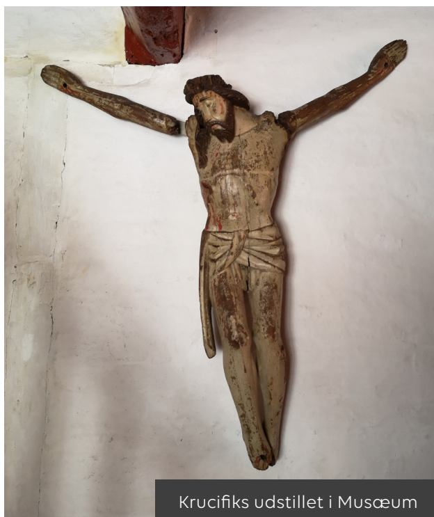
Krucifiks udstillet i Musæum