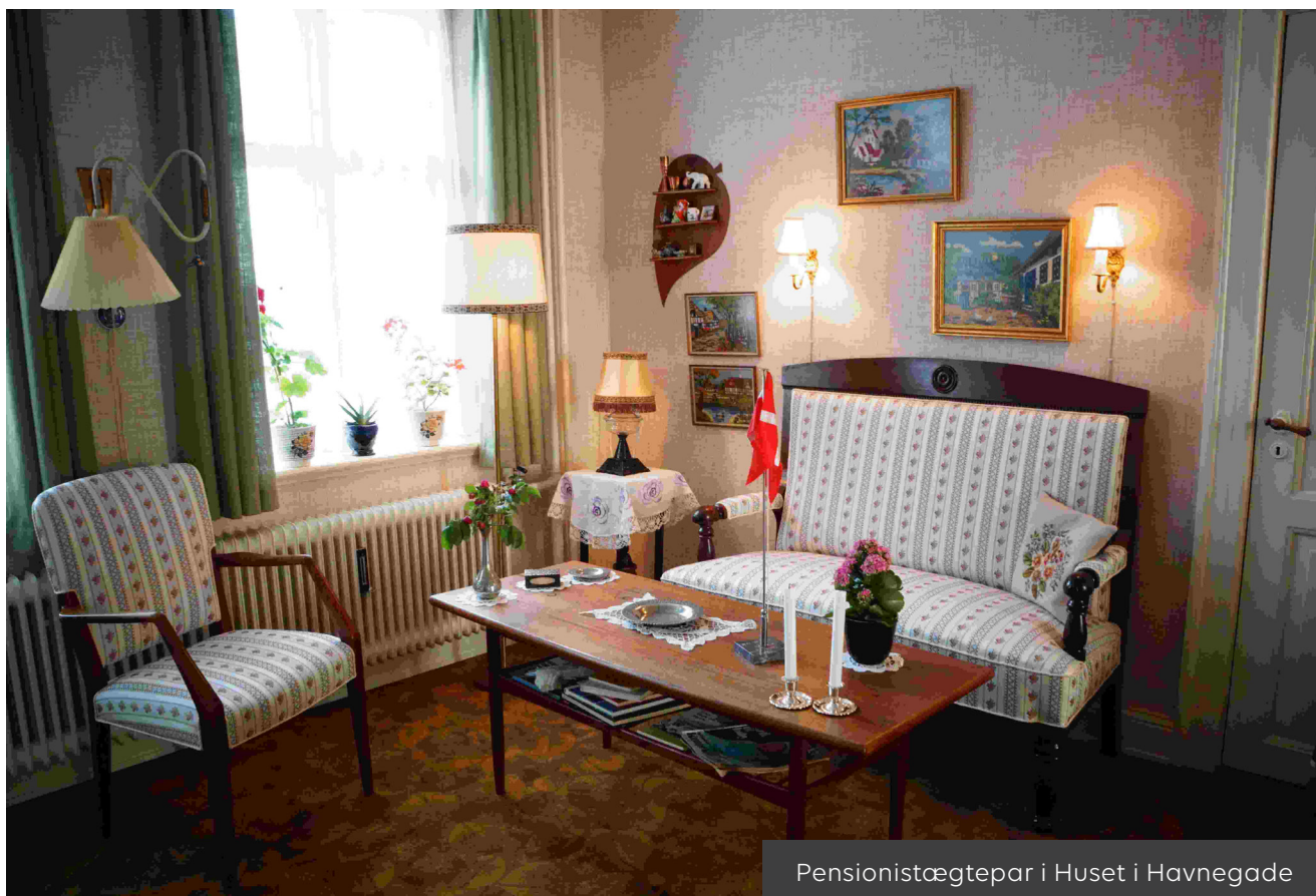
Pensionistægtepar i Huset i Havnegade