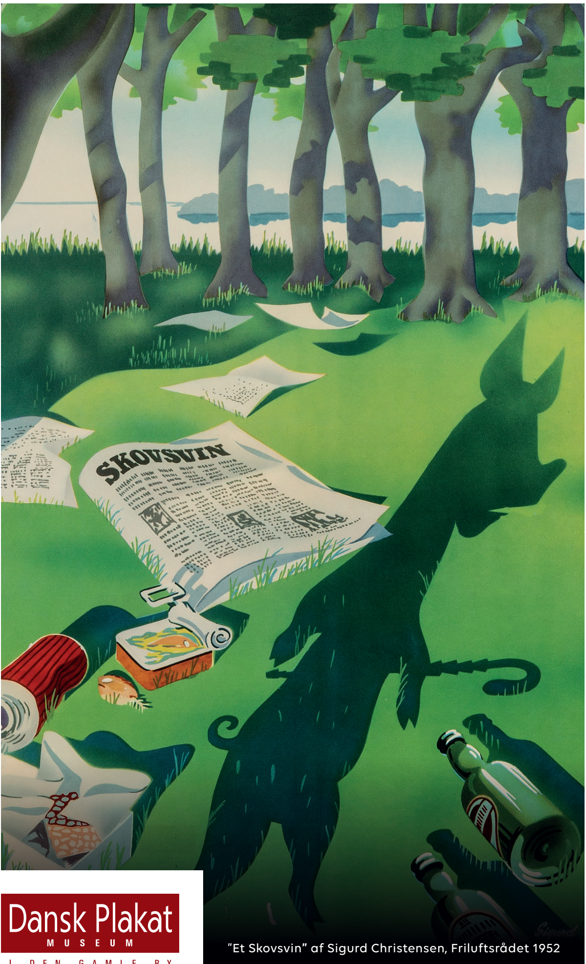
"Et Skovsvin" af Sigurd Christensen, Friluftsrådet 1952