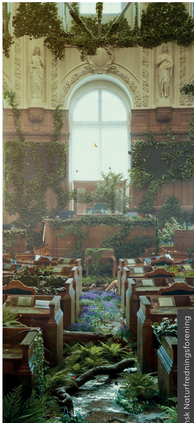
"Folketinget indtages af naturen", 2020