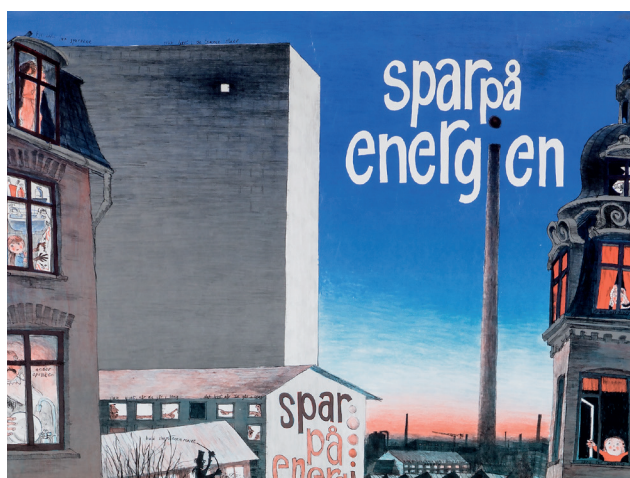
"Spar på energien" af Ib Spang Olsen, 1975