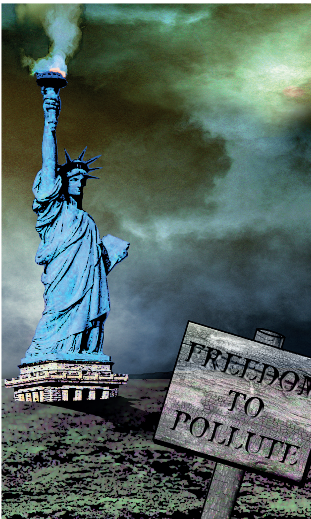
"Freedom to Pollute" af Jens Galschiøt, 2002

I denne opgave kan man vælge mellem at producere en kampagnefilm eller miljøplakat.