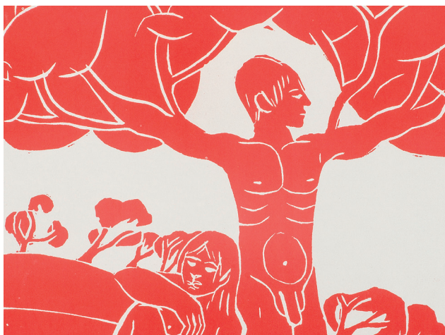
"Den Rene Natur/NOAH" af Røde Mor, 1967/69

De belyser udviklingen op gennem tiden fra det nære, lokale, nationale miljøfokus til den verdensomspændende, globale klimaindsats, og peger på hvilke samfundsmæssige konsekvenser det kan få, hvis vi ikke handler.